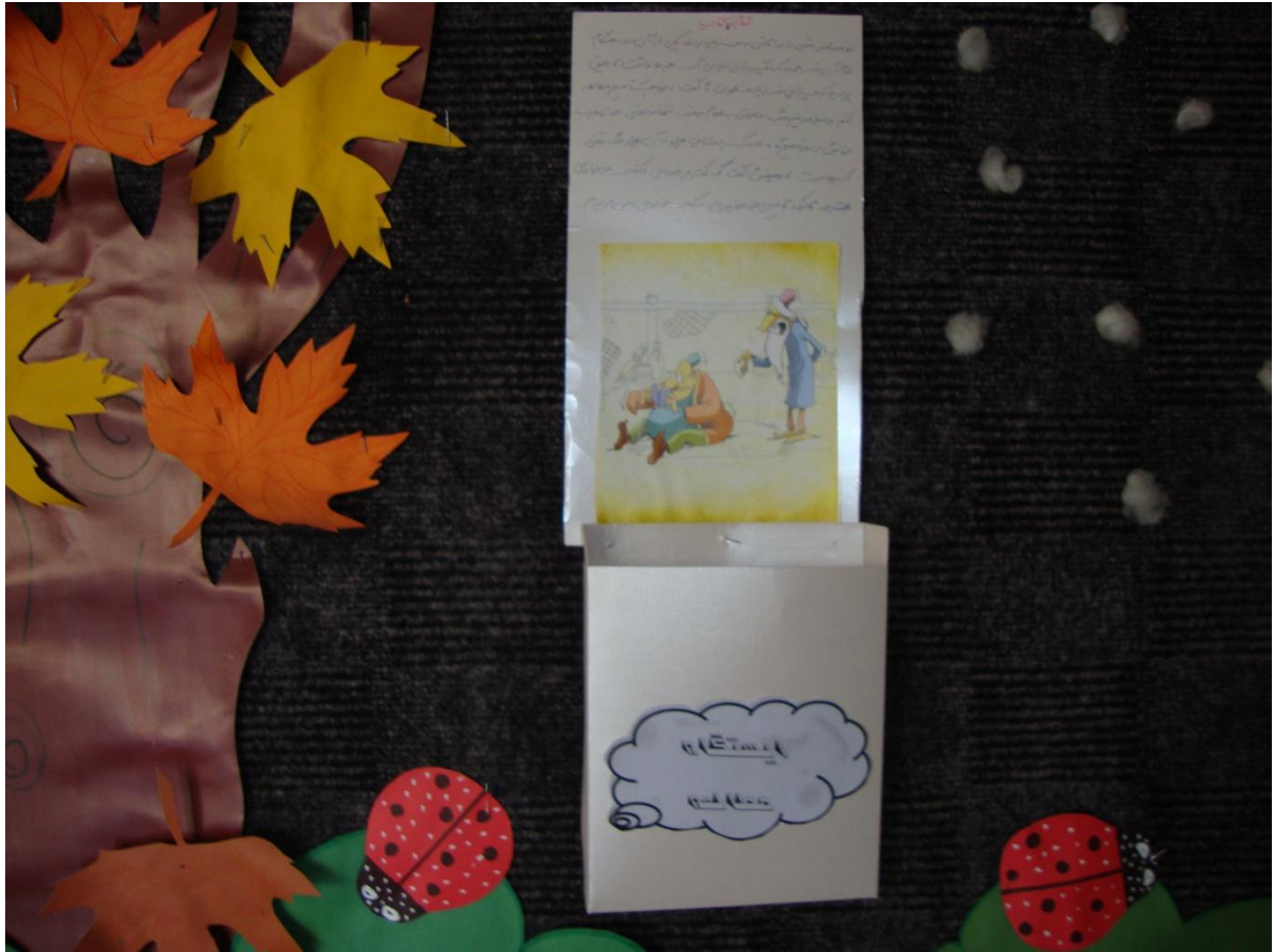
تهیه ایستگاه مطالعه ، کتاب دیواری و نصب در دیوار مدرسه